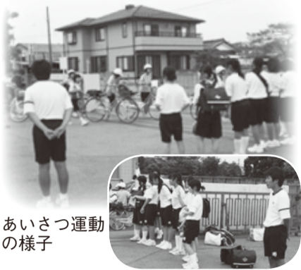
あいさつ運動の様子

夕方、下校時間15分前になると、南中正門前に生徒会本部役員が集まります。生徒会の目標の一つ「いつでもあいさつができる学校」の実践に向けた「あいさつ運動」の始まりです。今の本部役員結成以来、寒い日も暑い日も、雨や風の強い日も、目標達成に向けて強い気持ちで今日まで続けています。今では、あいさつを返してくれる人も増え、着実に目標に近づいていると感じます。また、私たちの活動に賛同してくれる友だち