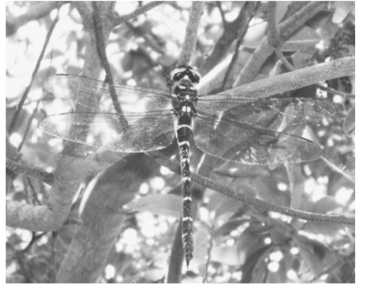
オオヤマトンボ (エゾトンボ科)

平地や丘陵地の湖や大きな池など、水面の開けた場所に生息するトンボ。黄色と黒の縞模様が目立ちオニヤンマに似ているが、オニヤンマより小さく、胸が青緑色でエゾトンボの仲間。オスは常時パトロールしており、ほとんど止まらないが、止まる時は木の枝などにぶら下がっている。(写真) 夏になると、羽生水郷公園の池や市内の遊水池で時々見かける。 (羽生の自然を楽しむ会)