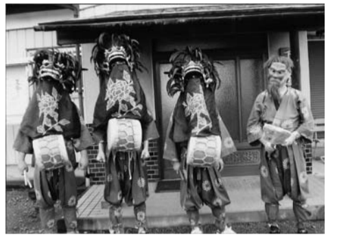
獅子頭と太鼓は平成6年に修繕し、それと同時に衣装を新調しました。先人から受け継いだ行事は、これからも大切にしたいものです。

それを頭にひもでしっかりと固定し、着慣れない服装で、最低でも3時間かかる猛暑の中での獅子の村まわりには、体力と気力が不可欠です。