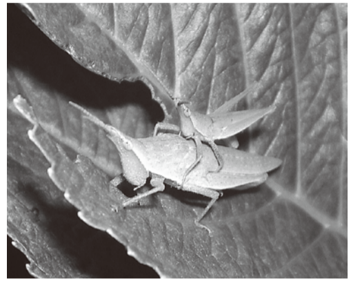
オンブバッタ (オンブバッタ科)