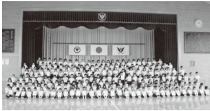
中227人と、たくさんの人が表彰されました。昨年度は埼玉県学校歯科保健コンクール（中規模校の部）で最優秀校にも選ばれました。この賞をもらったことを、みんなが誇りに思っています。

ハローワークでは、障がい者の雇用拡大および職業的自立と職業の安定を図るため、次のとおり障がい者就職面接会を開催します。 ▽日時 10月27日(水) 受付：午後零時30分～ 面接会：午後1時～4時