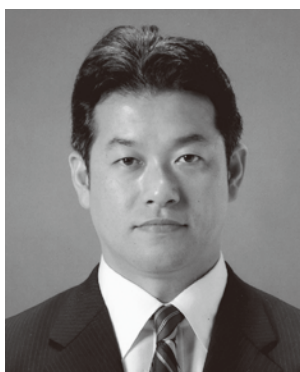
諸井 真英 42歳 加羽ヶ崎173 自由民主党

埼玉県議会議員一般選挙は4月1日に告示され、東第2区選挙区(羽生市・定数1)は、立候補届出者が1名で定数通りであったことから、無投票により現職の諸井真英氏が2期目の当選を果たしました。羽生市民の声を県政に反映させていただきますよう、ご活躍を期待しています。