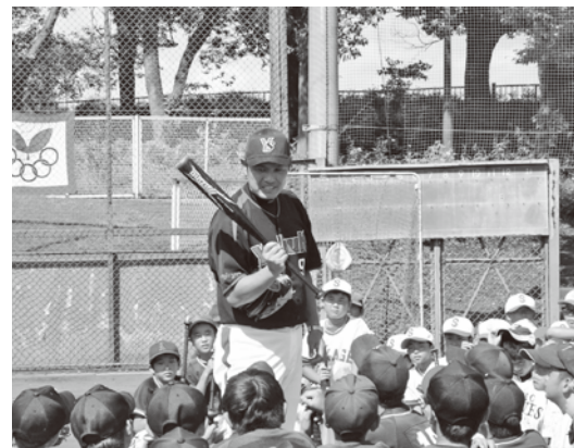
写真は昨年の様子

▽お問い合わせ お手順をおかけしますが、ご理解とご協力をお願いします。 市民生活課(内線135)