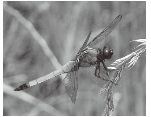
オオシオカラトンボ (トンボ科)

平地や山地の樹林がある湿地や池に生息する。 シオカラトンボと同じように、オス(写真)は成長すると粉を噴き、体全体は青みがかり、ずんぐりとしてくる。メスは胸の中央の太く黒い部分の前後が黄色く、まるで別の種類の生物のように見える。 市内では、利根川沿いの小川や沼、屋敷林の近くの田んぼなどで、まれに見かける。 (羽生の自然を楽しむ会)