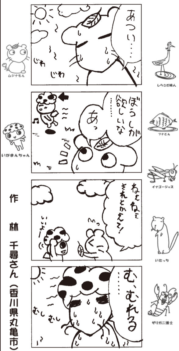
昨年募集した作品から、選ばれた12作品のうち毎月1作品を掲載しています。 ▶問い合わせ 商工観光課(☎560-3111)