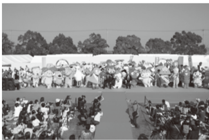
〈昨年のゆるキャラ®さみっとin羽生の様子〉

今年、昨年より多くのキャラクターの参加があり、北は北海道、南は宮崎県まで約150