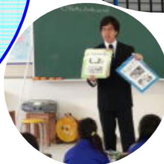
村君小ALT ポール・チャントラスミ (アメリカ合衆国)