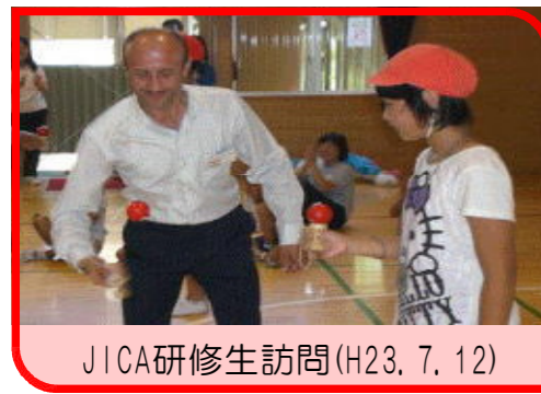
JICA研修生訪問(H23. 7. 12)

村君地区は自然が豊かで、住民は地域を愛する心情が強く、学校教育に対しても関心が高く協力的である。しかし、少子化による児童数の減少、地域の後継者不足等が課題となっており、地域の活性化が急務である。そこで、地域指定として本事業を実施することにより、子どもたち及び保護者、地域住民が英語に慣れ親しむ機会の充実を図り、地域全体で国際理解について関心を高めるとともに、地域全体を「元気」にして活性化を図る。