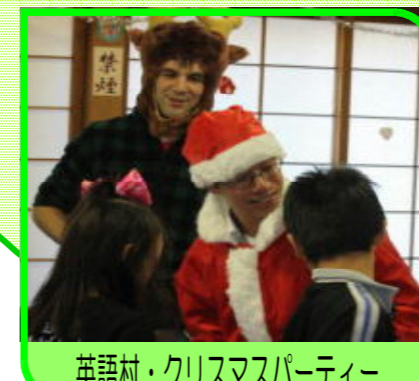
英語村・クリスマスパーティー