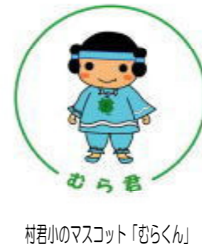
村君小のマスコット「むらくん」