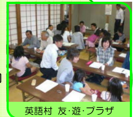
英語村 友・遊・プラザ