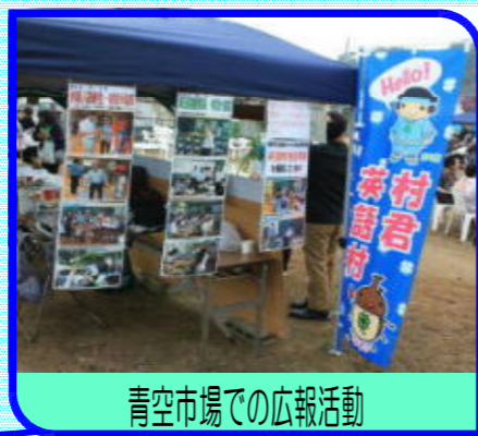
青空市場での広報活動