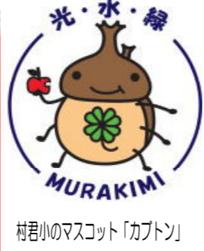
村君小のマスコット「カブトン」