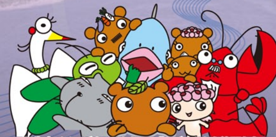
羽生市イメージキャラクター「ムジナもんとその仲間たち」