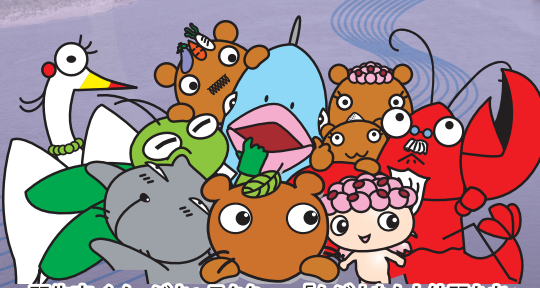
羽生市イメージキャラクター「ムジナもん仲間たち」