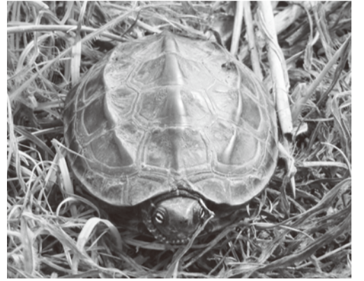
クサガメ (ヌマガメ科)

平地の河川や池沼などに生息する。体の色は茶褐色から黒褐色で、側頭部から首にかけて黄色い模様がある。甲羅には、三本の突起線がある。名前は、捕らえられたとき、臭線から臭い匂いを出すことに由来する。雑食性で、ザリガニや水生昆虫、水草、タニシなどを食べる。 市内では、田んぼや小川で姿、足跡を見かける。 (羽生の自然を楽しむ会)