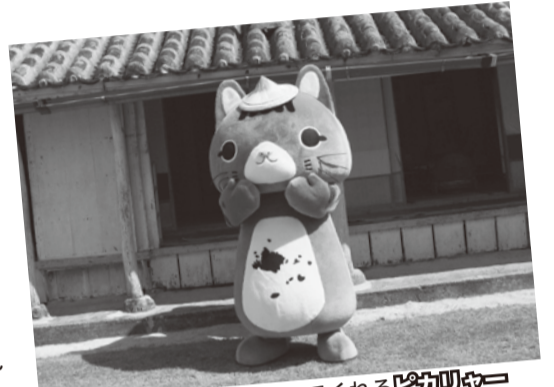
日本最南端から参加してくれるピカリャ〜