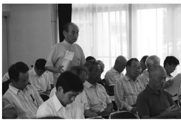
市民の皆さんから、たくさんの質問をいただきました

厳しい財政運営の中、高齢者施設に限らず、新たな施設を整備することは難しいと考えています。 Q 救急車を呼ぶ際には、どのようなことに気をつけなければなりませんか。 A 全国で救急車が出動し病気のケガにより病院へ搬送された方の、50%以上が軽症となっています。救急車を呼ぶ際は、擦り傷や、切り傷、打撲などの場合、本当に救急車が必要かをもう一度冷静に考えて、「必要はない」と判断された場合には、自家用車・タクシーなどを利用し医療機関に向かっていた方がいいと思います。