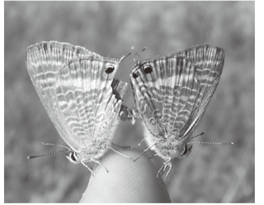
ウラナミシジミ (シジミチョウ科)

秋に全国各地の農耕地周辺で見られる蝶。市街地の花壇にもやって来る。羽の裏面に波形の模様があることから名付けられた。寒さに弱く、冬の訪れとともに死滅する。幼虫はマメ科の花や新芽などを食べる。 市内では、稲刈りが終わった頃に、ヤブツルアズキが繁茂する場所などで見かける。(写真は交尾したまま指先に止まった様子) (羽生の自然を楽しむ会)