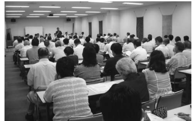
9地区で481名にご参加いただきました

Q 市広報紙の大きさをA4にしたらどうでしょうか。 A これまでも「広報はにゅう」のA4判化については、検討を重ねてきました。その際に一番課題となったのが、費用の問題です。現在、主に12ページから14ページで発行しているタブロイド判の広報紙は、A4判に組み直すと22ページから26ページになると考