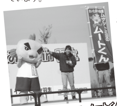
さみっと会場のキャラクタームートくん

仲間のムサシトミヨが待っています！好きなものは、『きれいな湧水』、特技は『友達づくり』です。たまに、きれいな湧水探しの旅に出ています。