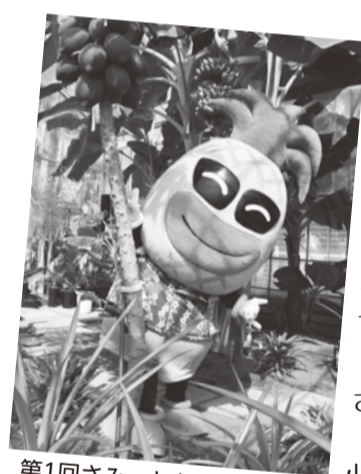
第1回さみっとから参加してくれているパイプル君

こんにちは♪ 僕の名前は『パイプル君』。ムジナもとはよく遊ぶ仲良しなんだ。8月17日(パイナップルの日)生まれで、トレードマークはサングラス♪ 僕のモデルはハワイ出身の元大関のあの。誰だかわかる？