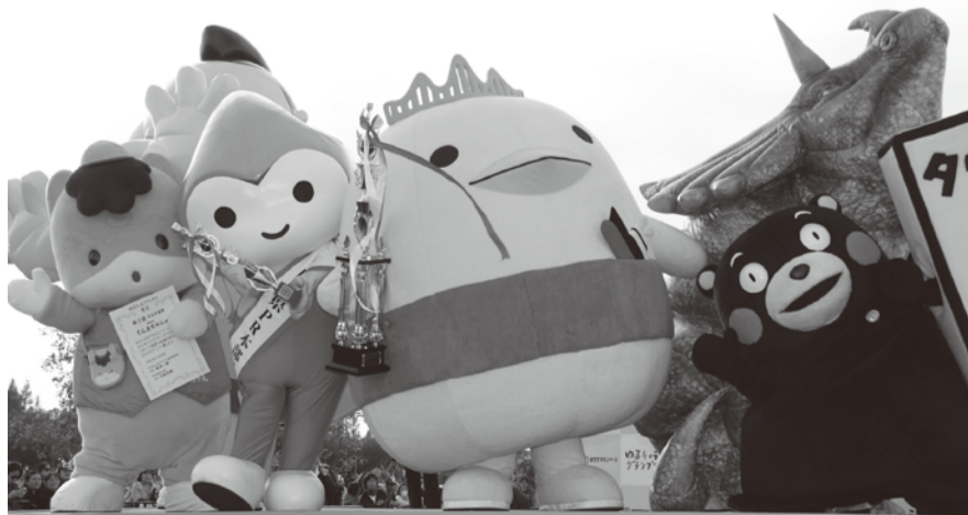
昨年のグランプリの様子

■記録挑戦 日時 11月23日(土) 午前9時から 場所 羽生水郷公園ステージ前広場