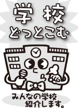
みんなの学校紹介します。

わねら、むぎずみこ 井泉小学校では、今あいさつ運動に力を入れています。朝一番の元気なあいさつは、明るい気分が一日が始まり、「今日もがんばるぞ」という気持ちにさせてくれます。先生方やPTAのみなさんの協力を得たり、クラス代表委員会で作った、あいさつカレンダーや賞状を用いたりして、毎日学校の中で元気なあいさつが聞かれるようになりました。 また、昨年には、井泉小学校のキャラクター「いずみん」が誕生しました。水をモチーフに、しず