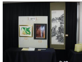
《団体・一般作品展》