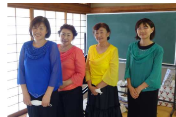
【アンサンブル和奏様による演奏会の様子】