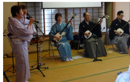
【梅若流梅謡会の皆さんの演奏会の様子】