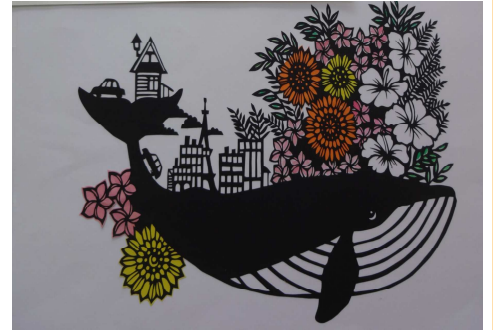
※作品のイメージです。

★申込み★:9月21日(土)から10月9日(水)までに 費用を添えて岩瀬公民館へお申込みください