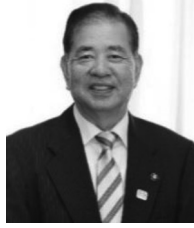
将来を担う 子どもたちのために 羽生市長 河田 晃明

近年、通信技術の発展に伴い、インターネットが誰でも気軽に利用できるようになりまし。便利になる一方、SNS上での誹謗中傷やいじめ、有害情報の氾濫をはじめ、子どもたちを取り巻く様々な問題が発生しております。子どもたちがSNSで巧みに騙されて事件に巻き込まれたり、知らぬ間に犯罪に加担させられたりと、不幸なニュースを耳にするたび心が痛みます。