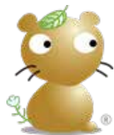
羽生市マスコットキャラクター 『ムジナもん』