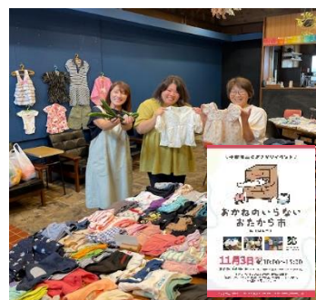
子ども服の譲渡会・交流会