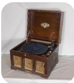
ちくおんき 蓄音機