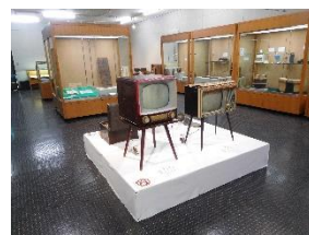
てんじ ようす 展示の様子