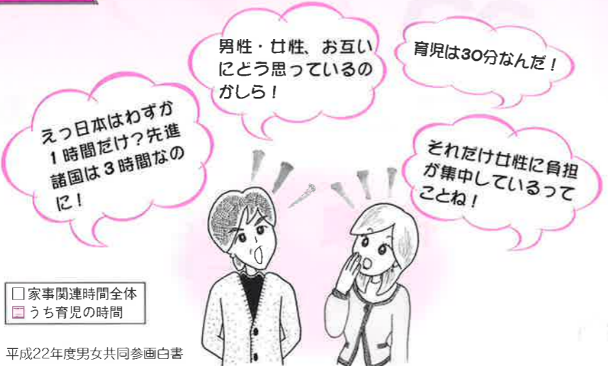
平成22年度男女共同参画白書 (備考) 1. Eurostat "How Europeans Spend Their Time Everyday Life of Women and Men" (2004), Bureau of Labor Statistics of the U.S. "America Time-Use Survey Summary" (2006) 及び総務省「社会生活基本調査」(平成18年)より作成。 2. 日本の数値は、「夫婦と子どもの世帯」に限定した夫の時間である。