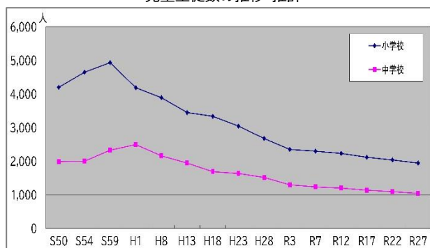
児童生徒数の推移・推計

子どもたちが集団の中で多様な考えに触れ、お互いに切磋琢磨しながら学力・学習意欲を高め、心と身体を健やかに成長できるようにするためには、一定の集団規模を確保することが必要です。