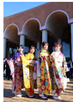
■表紙 「二十歳になりました！」