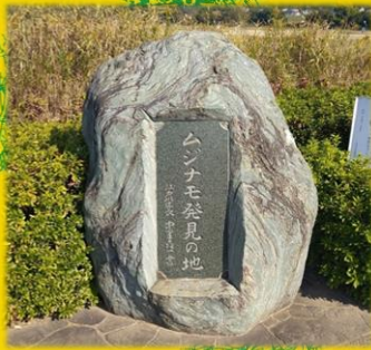
ムジナモ発見の地