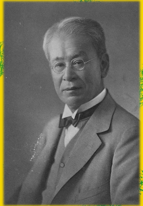
牧野富太郎