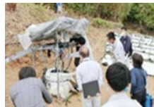
新たな担い手への指導