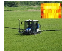
生育センサー付き 可変施肥機