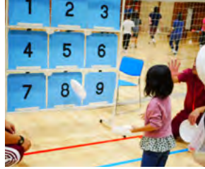
(上) フライングディスク。ディスクを投げて何枚パネルを射抜けるか競います。

体験ブースでは、誰もが気軽にスポーツやレクリエーションを楽しめる企画をご用意しています。このイベントをきっかけにスポーツを日常に取り入れ、健康な体を手に入れましょう。