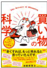
買い物の科学 ～消費者行動と 広告をめぐる心理学～ (越智啓太)

人体最大の臓器とも言われ、薄い構造のなかに多彩な機能を備える皮膚。皮膚の構造・機能、スキンケア、代表的な皮膚の疾患、最新の研究を盛り込んだ皮膚科学・皮膚科医療の未来などについて、ビジュアルでわかりやすく解説。