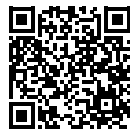
大会ホームページ