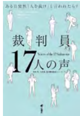
裁判員 17人の声 ～ある日突然「人を裁け」と 言われたら？ 17Voices of the 17Saiban～ (牧野 茂編著、大城 聡編著、 裁判員経験者ネットワーク編著)