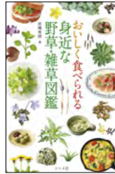
おいしく食べられる 身近な野草・雑草図鑑 (岩槻秀明)