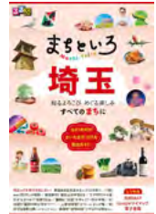
るぶまちとろ埼玉 ～知るよこびめぐる楽しみ すべてのまちに～ (JTB パブリッシング)