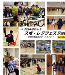
■表紙 「2024 スポ・レクフェスタ開催！」

06 CITY TOPICS 羽生南小が全日本学校関係緑化コンクールで特選を受賞