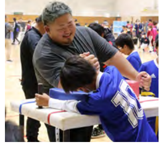
(下) アームレスラーに挑戦!