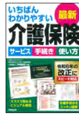
いちばんわかりやすい 最新介護保険 2024 ～サービス 手続き 使い方 最新改正に対応～ (伊藤亜記 / 監修)