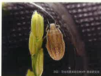
イネカメムシ幼虫 (5齢)