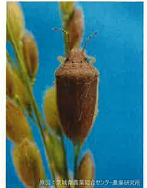
イネカメムシの成虫