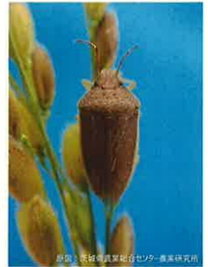
イネカメムシの成虫