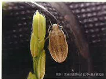
イネカメムシ幼虫 (5齢)