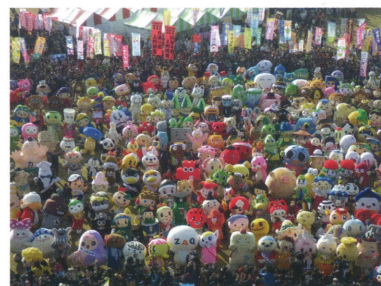
世界キャラクターさみっと