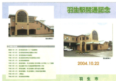
羽生駅駅舎建替え記念パンフレット