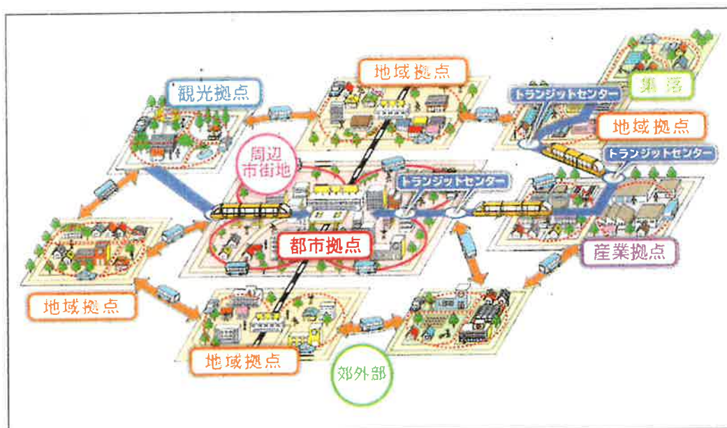
図1 NCCの都市構造のイメージ

これからの人口規模・構造や都市活動に見合った都市の姿である「ネットワーク型コンパクトシティ」（以下、「NCC」という。）を長期的なまちづくりの方向性として全国に先駆けて位置づけている。