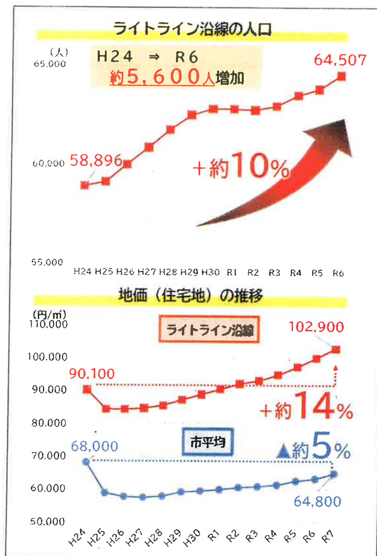
図2 ライトラインの整備効果（人口・地価）

移動時の利便性向上に資するよう、JR 宇都宮駅東口～芳賀町間で令和5年（2023）年8月に開業を迎えた次世代型路面電車「芳賀・宇都宮 LRT」（以下、「ライトライン」という）の停留場周辺や主要なバス停周辺などに、公共交通の移動の合間に買い物や仕事、勉強などができる施設を誘致するため、その整備費等への助成を行っている。