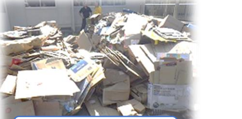
資源回収の段ボール