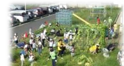
学年園もきれいになりました。

また、資源回収でも多くの方に資源物をお持ちいただきました。収益は子供たちのために役立てたいと思います。2・3学期も行う予定です。引き続き御協力をお願いします。