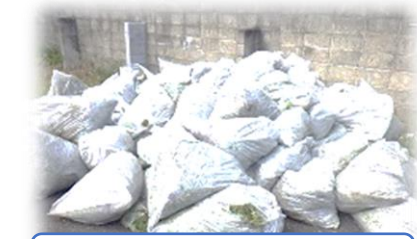
草がこんなにたくさん!