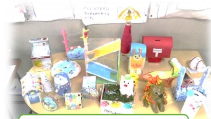
アイデア色々 貯金箱