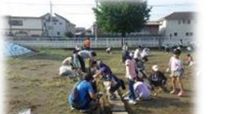
側溝のどろもきれいに!