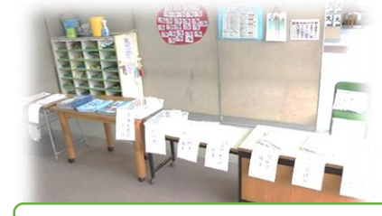
宿題たくさん がんばりましたね