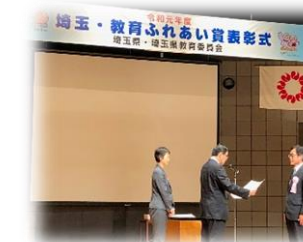
表彰式の様子 副知事より賞状を、教育長より副賞をいただきました。