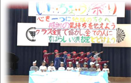
詩を表現したクラス