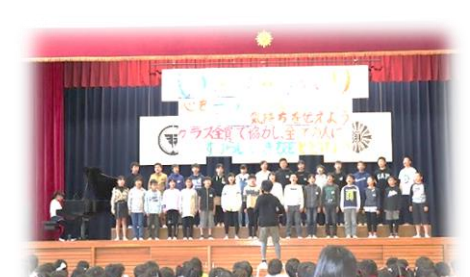
しっとりと歌い上げたクラス