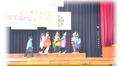
劇を披露したクラス