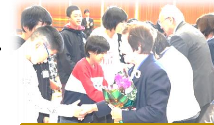
日頃の感謝を込めて