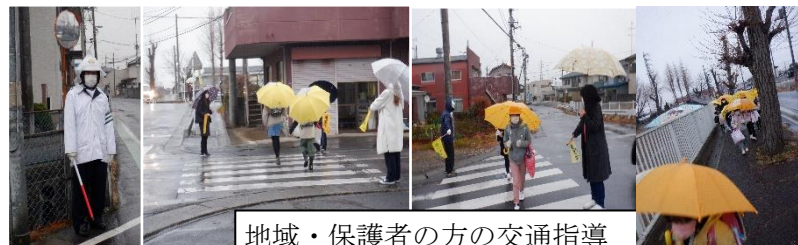
地域・保護者の方の交通指導