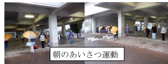
朝のあいさつ運動

11日は、小雨降る中でしたが、子供たちは元気に登校して来ました。プロティでは、生活安全委員会の5・6年生が、大きな声で挨拶運動を行っていました。通学路では、交通指導員さんやスクールガードリーダー、交通当番の保護者の方や教諭が登校指導を行っていました。教室では、担任の先生の3学期のメッセージがあり、教室を温かくしていました。始業式は、1・3・5年生が体育館、他の児童は教室でリモート参加、しっかりと話を聞く態度が観られました。久々の授業も、担任の先生とのやりとり笑顔があふれていました。下校時には、見守り隊の多くの方々が、子供たちの安全に尽力してくださっていました。地域や保護者の皆様に見守られ、子供たちは感謝の気持ちと共に成長しています。