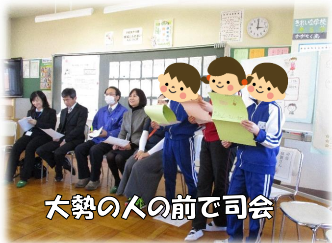
大勢の人の前で司会