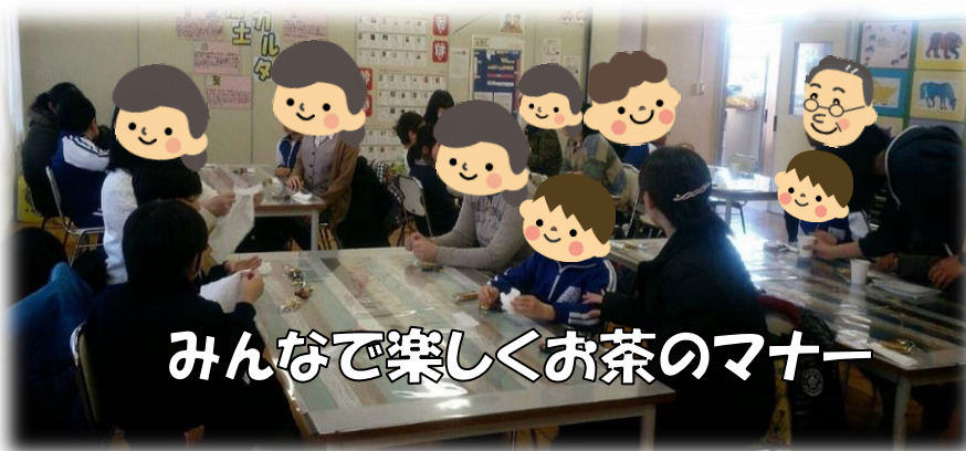
みんな楽しくお茶のマナー