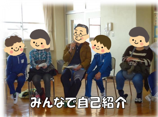
みんなで自己紹介