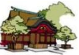
41 福岡・大宰府天満宮