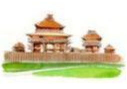
44 佐賀・吉野ヶ里遺跡