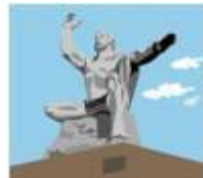
45 長崎・平和祈念像