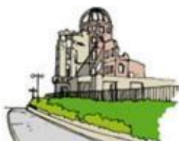
37 広島・原爆ドーム