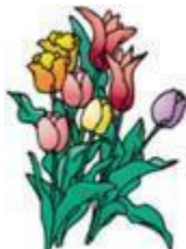
⑰富山・チューリップ