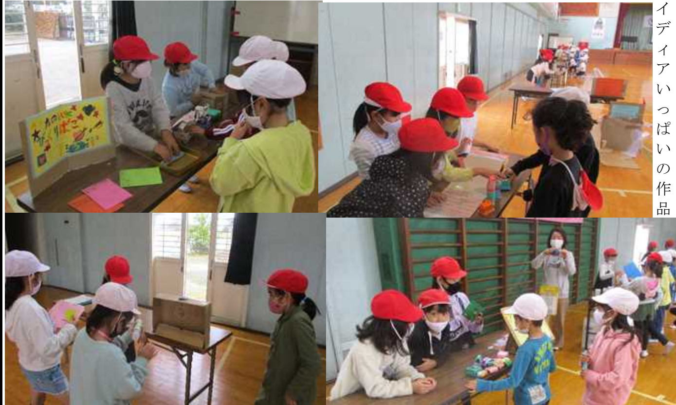
アイデアいっぱいの作品