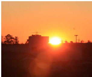
【令和4年の初日の出】

新年あけましておめでとうございます。希望に満ちた令和4年がスタートしました。旧年中は本校の教育活動に御理解と御協力をいただき感謝申し上げます。本年もどうぞよろしくお願いいたします。