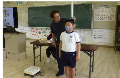
保健指導終了後身長・体重を測定しました