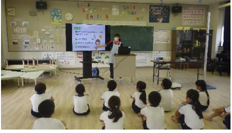
保健指導「生活習慣を見直そう」

8月31日に身体測定、9月7日に歯科健診を実施しました。身体測定時、「生活習慣を見直そう」という題で規則正しい生活についてクイズ形式で保健指導を行いました。自分の生活を見直し、元気に2学期を過ごしましょう。